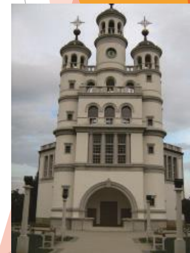
Cerkev Svete Trojice v Lendavi