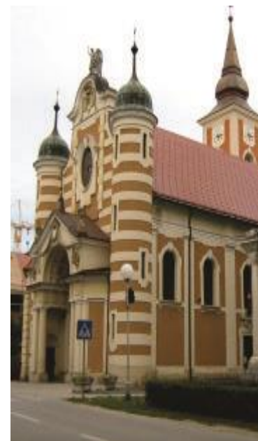
Cerkev Sv. Nikolaja v Beltincih