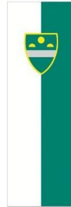
GRB IN ZASTAVA

Grb na sodoben način povzema podobo ravninskega mesta, ki se kot srebrna črta blešči na robu horizonta nad katerim vzhaja in zahaja sonce.