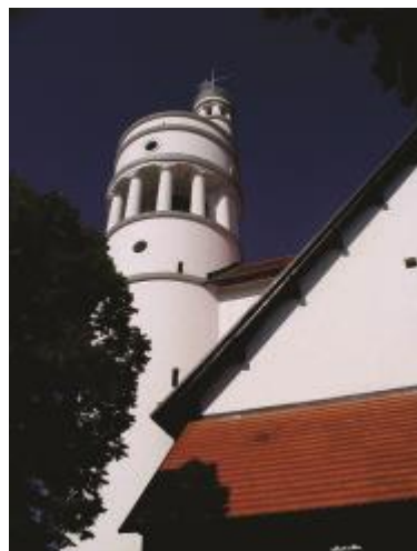
Plečnikova cerkev v Bogojni

»Otok ljubezni« v Ižakovcih, ki se ponaša s plavajočim mlinom na reki Muri in brodom, ki ohranja starodavni način prečkanja reke Mure.