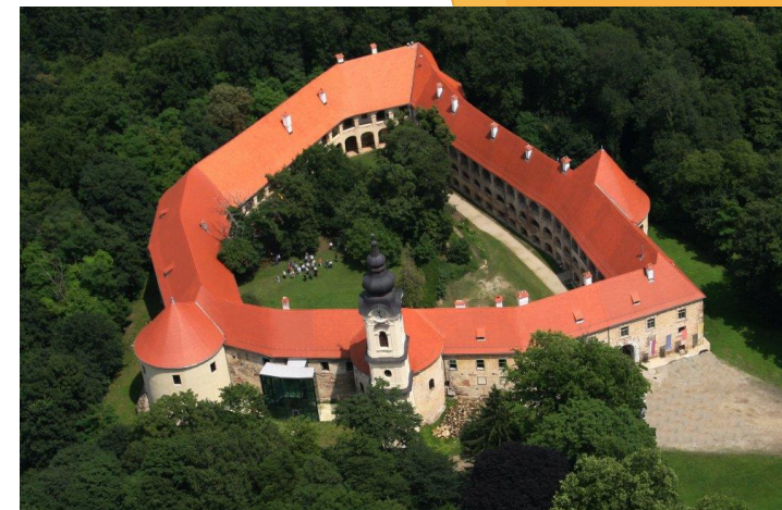
Največji grad na Slovenskem - grad na Goričkem